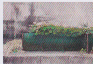
備中 鼎 ココにも早春