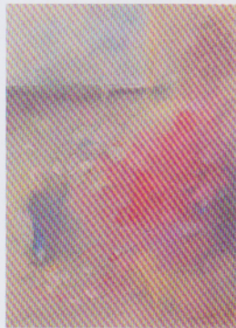
前田 敦子 私のスペース