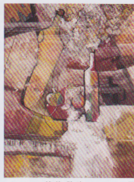
後藤 弥生 2013・夏