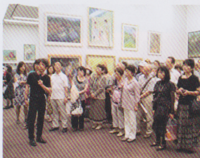
第25回展人物画制作実演風景

現代パステル協会は、パステルを主な素材とした本格的なタブローとしての制作を志して、1989年に日本で初めてのパステル画公募団体として誕生しました。日本にとどまらず広く海外からも出品を募り、第25回展よりアメリカ・サウスイースタン・パステル協会、第26回展よりフランスパステル画家協会と提携を結びました。絵画芸術の追求と研鑽を重ねる作家の発掘育成を図り、パステル画の普及と発展に寄与することを目指しています。