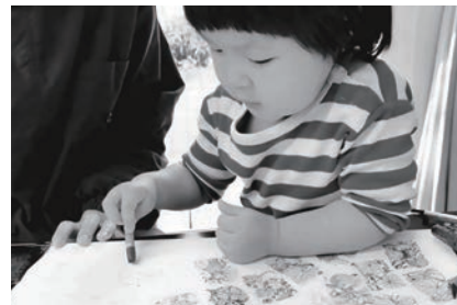
Photo: これまで実施してきたワークショップや授業の様子。左上から時計回りに、府中市美術館ワークショップ (2017)、粟島での制作 (2018)、女子美術大学授業 (2016)、まちの寺子屋 (2017)、府中市美術館ワークショップ・トーク (2017)

トーキョーワンダーウォール賞 (09年)、VOCA 奨励賞 (14年)、個展「鳥よ、僕の骨で大地の歌を鳴らして」(第一生命ギャラリー、東京、15年)、「絵とことばのまじわりが物語のはじまり」(太田市美術館・図書館、群馬、17年)、「万物の眠り、大地の血管」(府中市美術館 公開制作、東京、17年)、「アグロス・アートプロジェクト 明日の収穫」(青森県立美術館、青森、17年より継続中) 多摩六都科学館のプラネタリウム全天 88 星座の原画制作、南沢氷川神社への天井画奉納、東京大学海洋研究センターへの天井画を制作。その他、アニエス・ベー主催による海洋調査船タラ号のプロジェクトへの参加などがある。